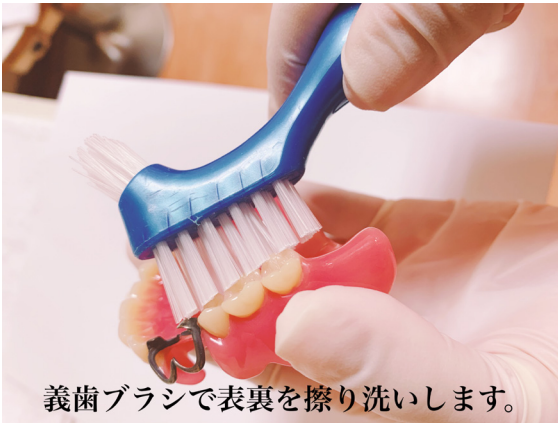
義歯ブラシで表裏を擦り洗いします。