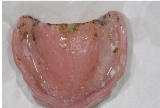
不潔な状態の義歯

義歯を使用されている方はどんなお手入れをなさっていますか？ 不潔な義歯には、体に悪い菌が沢山発生しています。